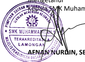
AENAN NURDIN, SE., MM